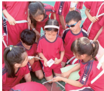
復活節數學領域闖關活動