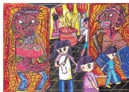
繪畫佳作-祈福-一愛范庭照