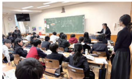
與南山師生一同上課