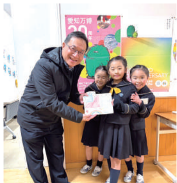
校長與南山學生合影