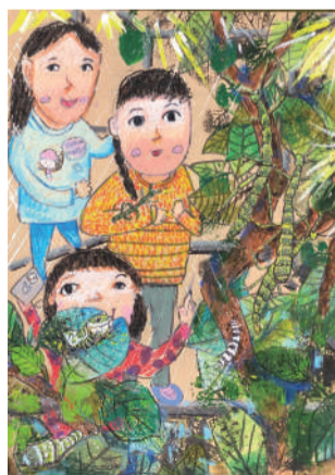
繪畫佳作-可愛摩斯拉 二望莊蕎伊