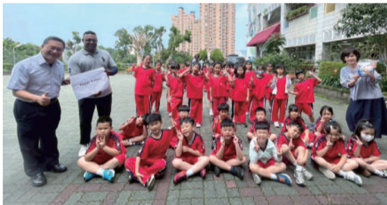
復活節英文尋蛋活動

耶穌復活日後，校園裡充滿喜樂的氣息，孩子們歡喜尋找象徵新生的復活蛋，也頌詠著聖言聖歌。愛心便當日是歡慶的高峰，吃著家長親自準備的午餐，臉上洋溢著歡樂。而當日午餐的經費作為奉獻的經費，更是讓愛遠颺，這將是聖心孩子難忘的記憶。