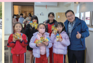
ESL 英語八樂 & 英語 Follow Me