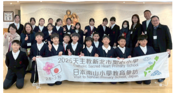
南山小學教育參訪

這次的寄宿體驗，讓我深刻體會到文化交流的珍貴。透過與寄宿家庭的互動，我不僅對日本的生活方式有了更深入的理解，也學會了感恩與珍惜，這是一段無可取代的回憶。南山小學的參訪之旅，讓我親身體驗當地的教育方式、學習環境與學生的生活態度，在寄宿家庭的陪伴下，更感受到不同文化的溫度。這不僅是一場學習之旅，更是一場心靈的洗禮。我深信，這段回憶將成為我人生中彌足珍貴的一部分，也讓我對未來的學習與生活有了新的啟發。