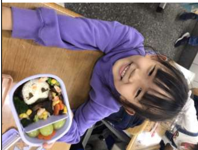
跟媽媽一起做的造型便當