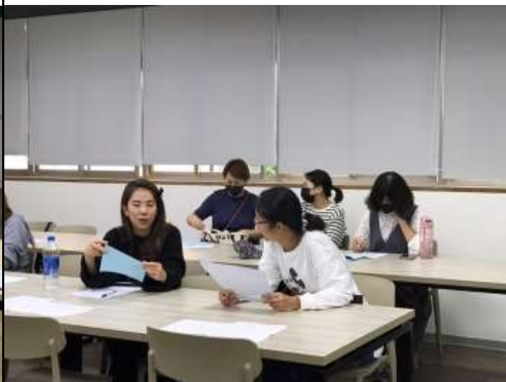
家長彼此分享經驗