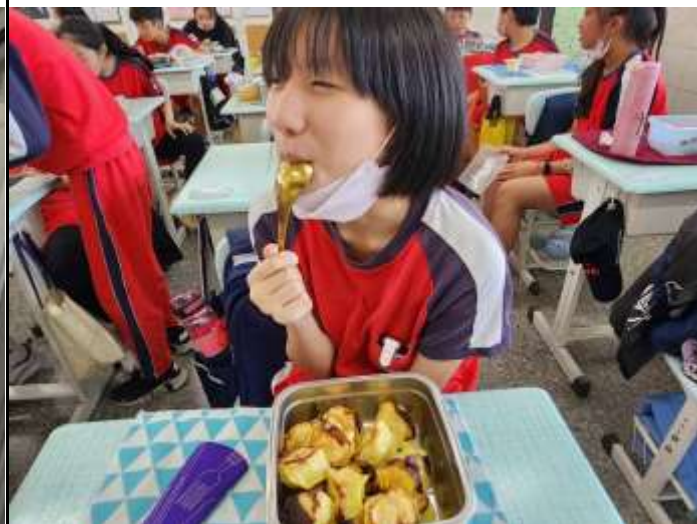
開心享用家長準備的 愛心便當