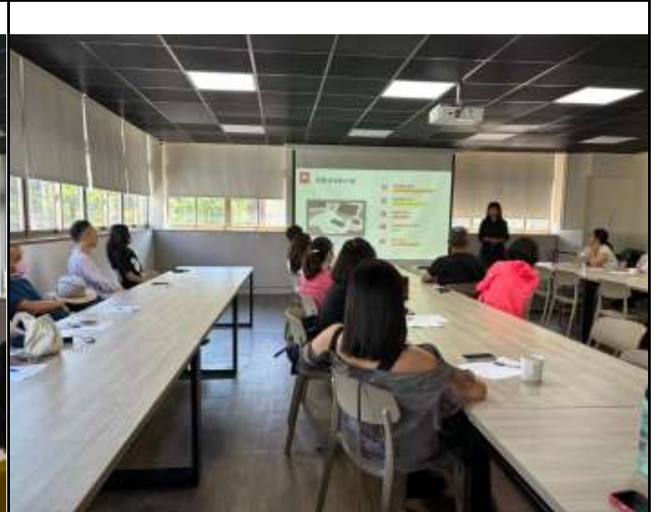
了解現在孩子與3C產品