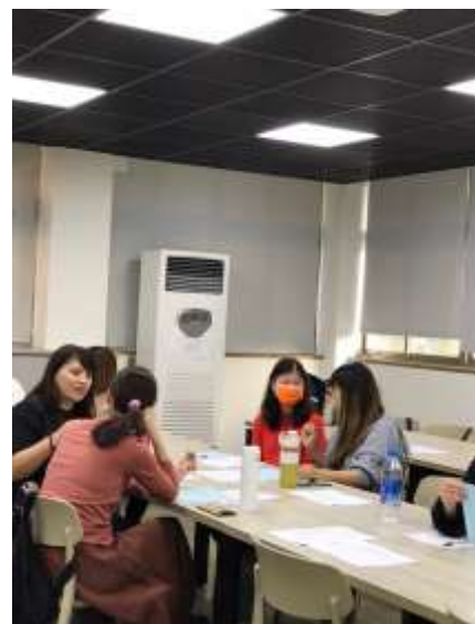
家長彼此分享經驗