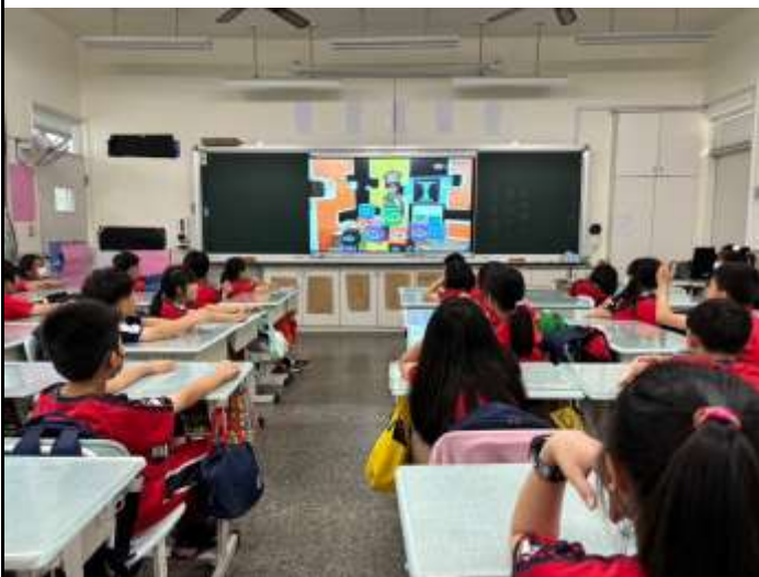
情緒介紹影片欣賞