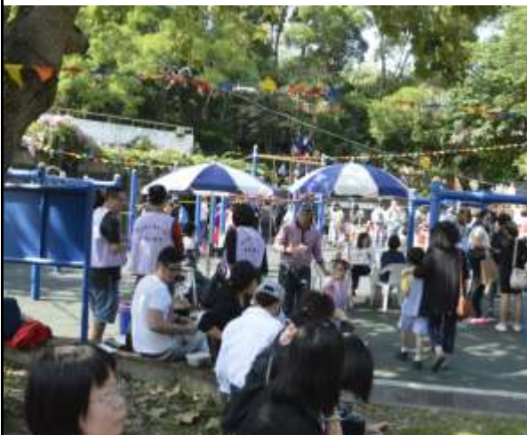
邀請阿公阿嬤一起來