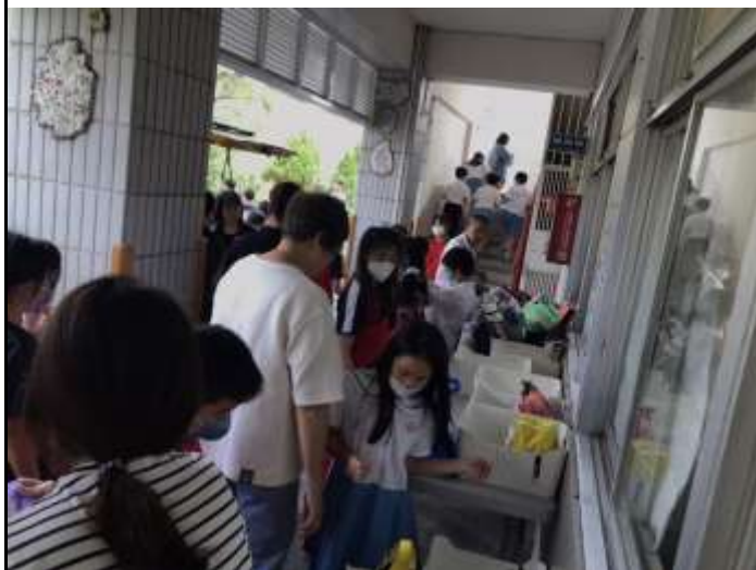
親自將熱騰騰的便當送到校