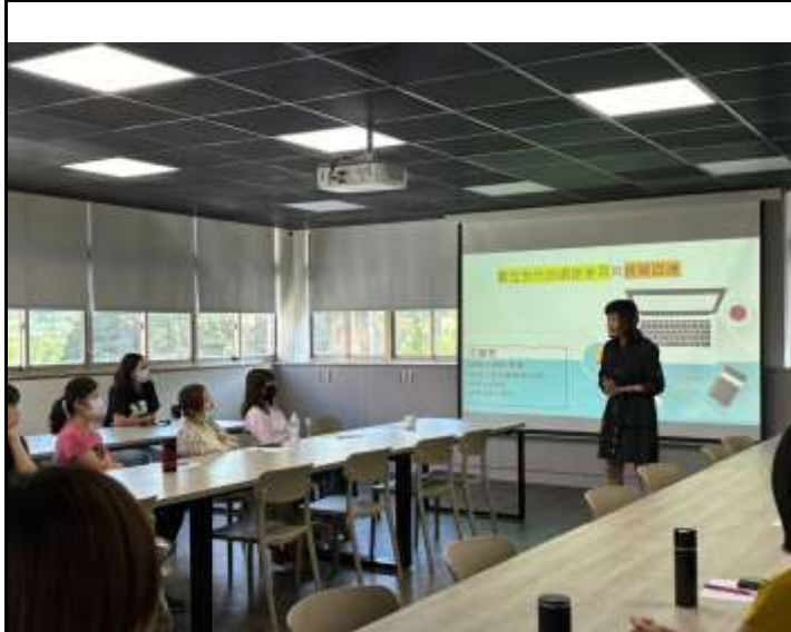
講師介紹科技發展