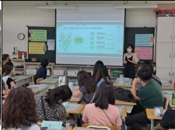
至各班教室與導師分享